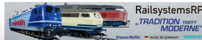
Mit aufwendiger Sondergestaltung zeigt sich die 248 002-8 der RailSystems RP GmbH (RP).